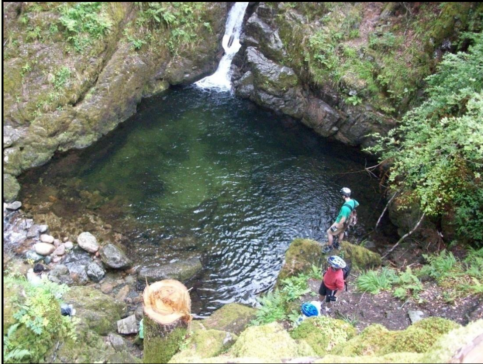
Le Saut de la Truite