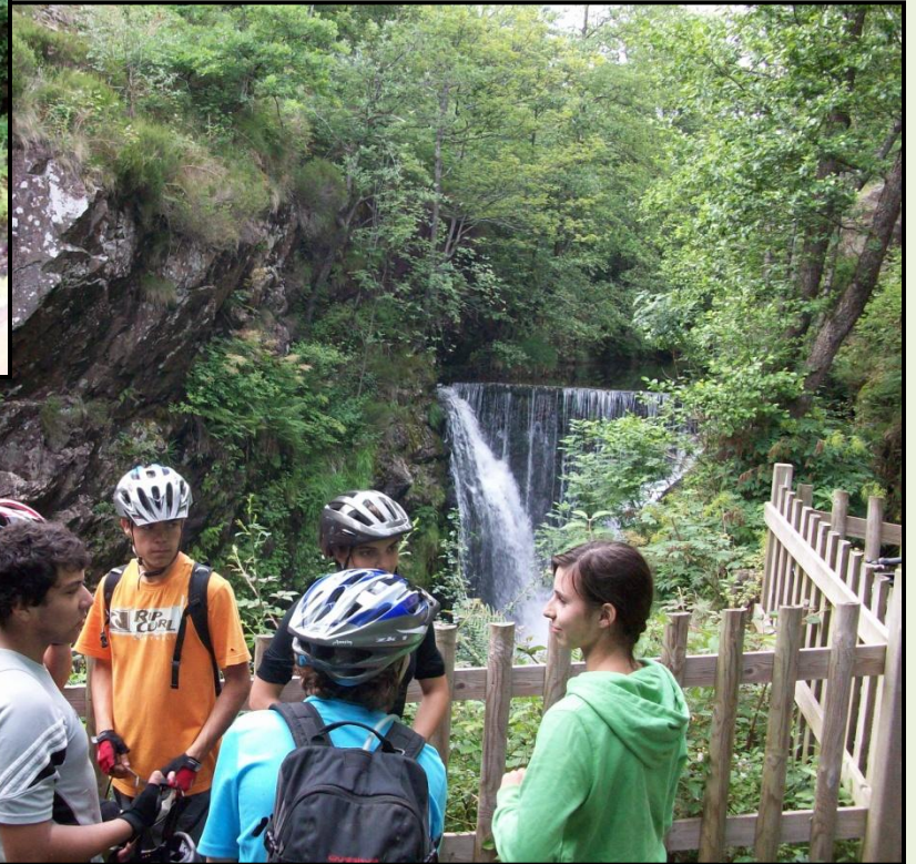
Le Saut de l'Ognon