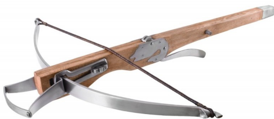
(a) Une arbalète du XIV e siècle.

L'arbalète, figure 1a, est une arme de trait 1 , au même titre que le lance-pierre, figure 1b.