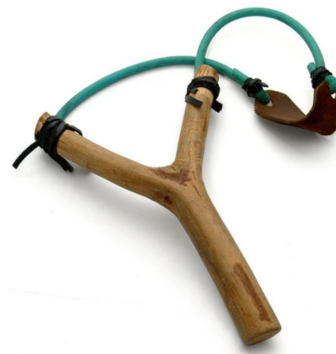
(b) Un lance-pierre.