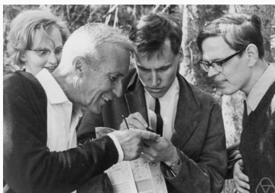
Kolmogorov et trois de ses étudiants en 1965

A partir de 1925, il s'engage dans une refondation des probabilités pour leur donner un ancrage plus moderne : malgré son jeune âge, ses résultats sont reconnus unanimement et c'est son axiomatique qu'on utilise aujourd'hui.